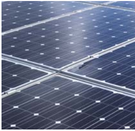
Monokristallines Photovoltaik-Modul Vitovolt 200