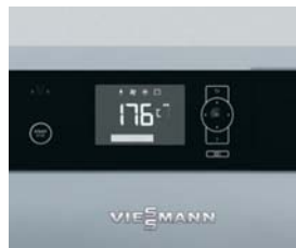
Regelung Ecotronic 100 mit beleuchtetem Display für einfache und intuitive Bedienung

Der Vitoligno 150-S ist ein kompakter, preisattraktiver Scheitholz-Vergaserkessel, der sich sowohl für den monovalenten als auch bivalenten Betrieb (Ergänzung zur Öl- und Gas-Heizungsanlagen) eignet.