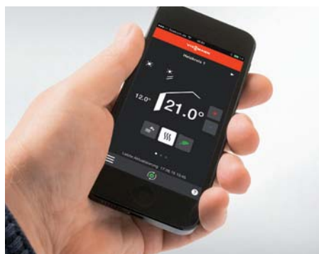
Komfortable Bedienung über Viessmann App per Smartphone aus dem Wohnzimmer

Der kompakte Scheitholzessel ist auch eine hervorragende Wärmeergänzung von bestehenden Öl- oder Gas-Heizungsanlagen. Dann übernimmt er im bivalenten Betrieb die Grundversorgung mit Heizwärme und Warmwasser. Erst bei extrem niedrigen Temperaturen wird der konventionelle Heizkessel zur Abdeckung der benötigten Spitzenlast zugeschaltet.